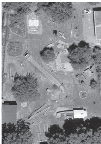
Vogelperspektive auf 2000qm Aussengelände

Woche vom 8. – 12. April 2024 Nachmittags, von 14:00 – 17:00 Uhr Freies Spiel & allfälliges Programm vor Ort