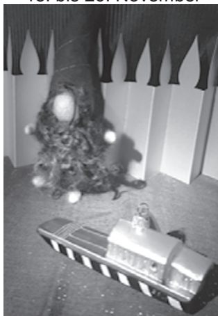
MärliNami in der Fähre Mittwoch, 20. Dezember