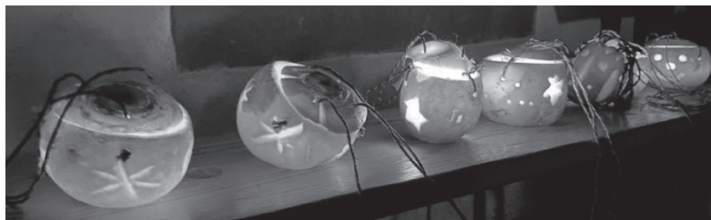
Räbeliechtli-Umzug / Mittwoch, 8. November