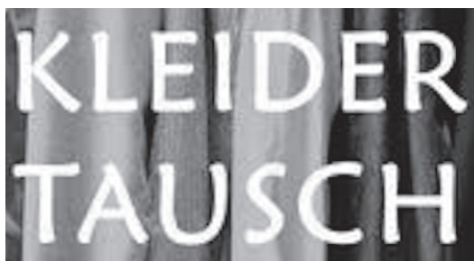
Frauenkleidertauschabend Freitag, 15. September Kinderkleidertauschvormittag Samstag, 28. Oktober