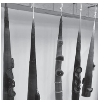
Kerzenziehen 18. bis 26. November

Und wie immer ☺ Pavillon und 2000qm Aussen- gelände offen am Mittwoch- und Frei- tagnachmittag. Plus Mi-Nami Anima- tion für Kinder ab Schulalter