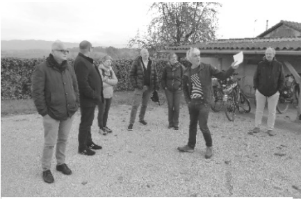
Vor dem Schulhaus Diemerswil

wendig und logische Folge der bisherigen guten Zusammenarbeit erachtet wird.