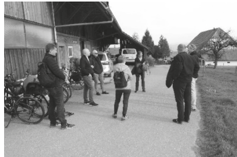
Kohlholz, der neu höchste Punkt Buchsis