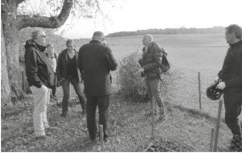
Der GR am östlichsten Punkt