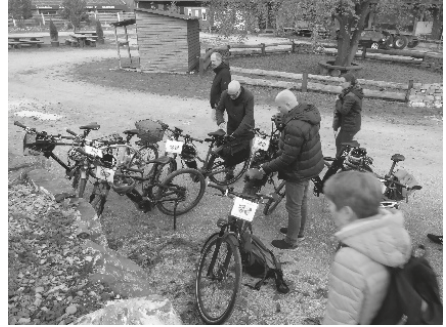
Weiterfahrt ab der Mettlen

Der Ausflug ermöglichte uns herzliche Begegnungen mit Menschen aus Diemerswil. Vielen Dank an alle Diemerswilerinnen und Diemerswiler, welche uns stellvertretend für die ganze Bevölkerung empfangen und aus ihrem Leben erzählten. Die Begegnungen zeigten uns auf, dass für viele Diemerswilerinnen und Diemerswiler diese Fusion als not-