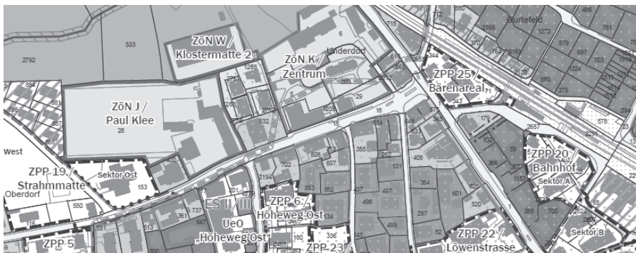
Abb.: Ausschnitt aus Nutzungszonenplan OPR17+, Stand öffentliche Auflage Okt. 2020

Das Dossier der Ortsplanungsrevision OPR17+ lag von Mitte Oktober bis Mitte November 2020 öffentlich auf. Aus der Auswertung der zahlreich eingegangenen Einsprachen geht hervor, dass die planungspolitische Zielsetzung zur Siedlungsentwicklung nach innen grundsätzlich breit mitgetragen wird. Diese wird aber häufig anders beurteilt, wenn sie Grundeigentümerinnen und Grundeigentümer auf ihrem Grundstück direkt betrifft. Ein Grossteil der Einsprachen steht zudem in direktem oder indirektem Zusammenhang mit den planungsbedingten Mehrwertabgaben.