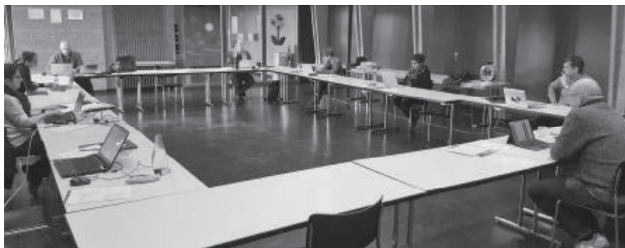
23.03.2020; die erste GR-Sitzung in der Aula Paul Klee

Zwischenzeitlich ist der Gemeinderat zurück in seinem angestammten Sitzungszimmer an der Bernstrasse 8, wo er Tagesgeschäfte behandelt, jedoch auch laufend beobachtet, wie sich die Lage betreffend Covid-19 entwickelt und sich bereit hält, den Staat in einer nächsten ausserordentlichen Lage funktionieren zu lassen.