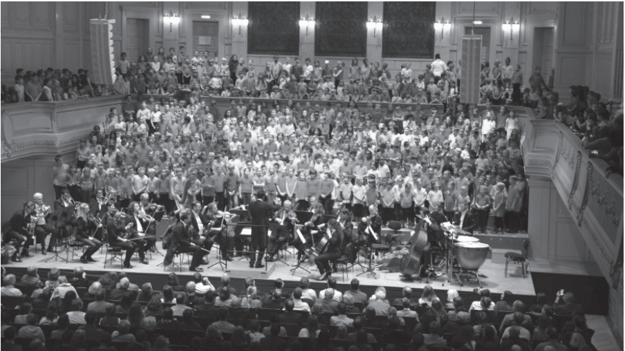
Konzert im Casino Bern vom 13. Dezember 2019

Das Konzert im Kirchgemeindehaus war zugleich eine Hauptprobe für den grossen Auftritt im Casino Bern im Rahmen von „sing mit uns“, welcher am 13. Dezember von den Schülerinnen und Schülern mit grossem Erfolg bestritten wurde.