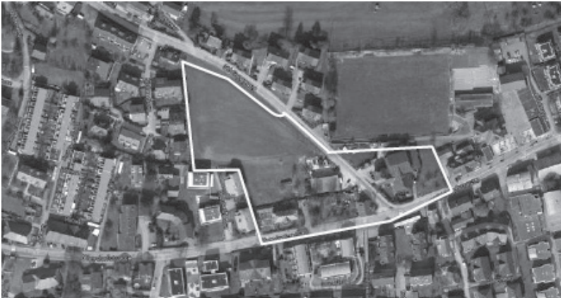
Abbildung: Planungsgebiet Strahmmatte mit geltendem ZPP-Perimeter (gelb)

Damit die vorgesehene Überbauung Strahmmatte realisiert werden kann, ist eine Anpassung von Zonenplan und Baureglement im Bereich der Zone mit Planungspflicht ZPP Nr. 19 erforderlich. Die entsprechende Änderung der ZPP Nr. 19 wird am 05. Dezember 2019 im Parlament behandelt und voraussichtlich am 09. Februar 2020 dem Volk zur Abstimmung vorgelegt.