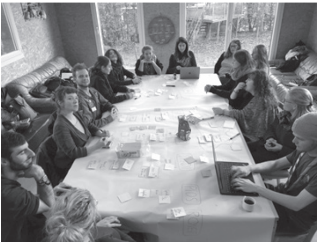
Die Leitenden planen im Heim das Pfadijahr 2020

Weitere Infos zum Heim und zur Pfadi Buchsi findet ihr auf unserer Webseite: www.pfadibuchsi.ch