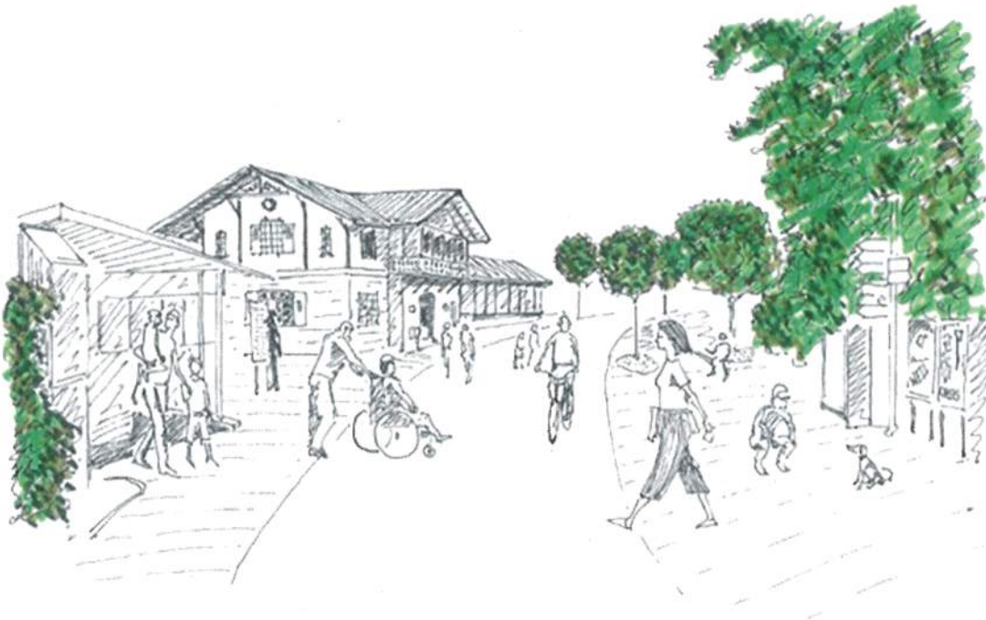
Vision Bahnhofplatz Buchsi «Flanierzone»