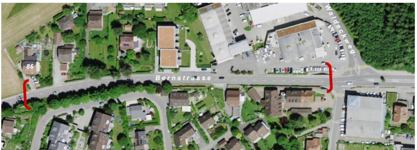
Abschnitt Liegenschaft Bernstrasse 86 und Waldeckweg