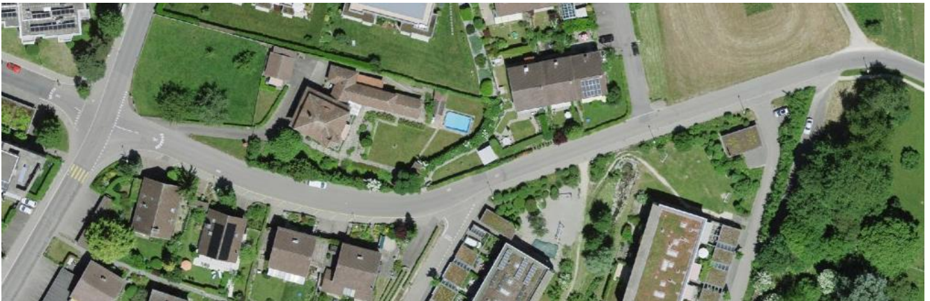
Hofwilstrasse, Abschnitt Mühlestrasse bis Parzelle Lehrerhaus

Wie gut eine vorgeschriebene Höchstgeschwindigkeit eingehalten wird, steht in direktem Zusammenhang mit dem Erscheinungsbild einer Strasse. So wird Tempo 30 erfahrungsgemäss nur dann ohne weitere Verkehrsberuhigungselemente eingehalten, wenn der Ausbaustandard bereits niedrig ist (schmale Fahrbahn, Querstrassen mit Rechtsvortritt, Unübersichtlichkeit, Parkfelder auf der Fahrbahn etc.). Aufgrund ihres Ausbaustandards entspricht die mit Tempo 30 geführte Hofwilstrasse, über die meisten Abschnitte zwischen der Mühlestrasse und der Gebäudegruppe Hofwil, nicht dieser nötigen Einheit von Bau und Betrieb, so dass flankierende Massnahmen zur Unterstützung der Einhaltung der signalisierten Höchstgeschwindigkeit erforderlich sind.